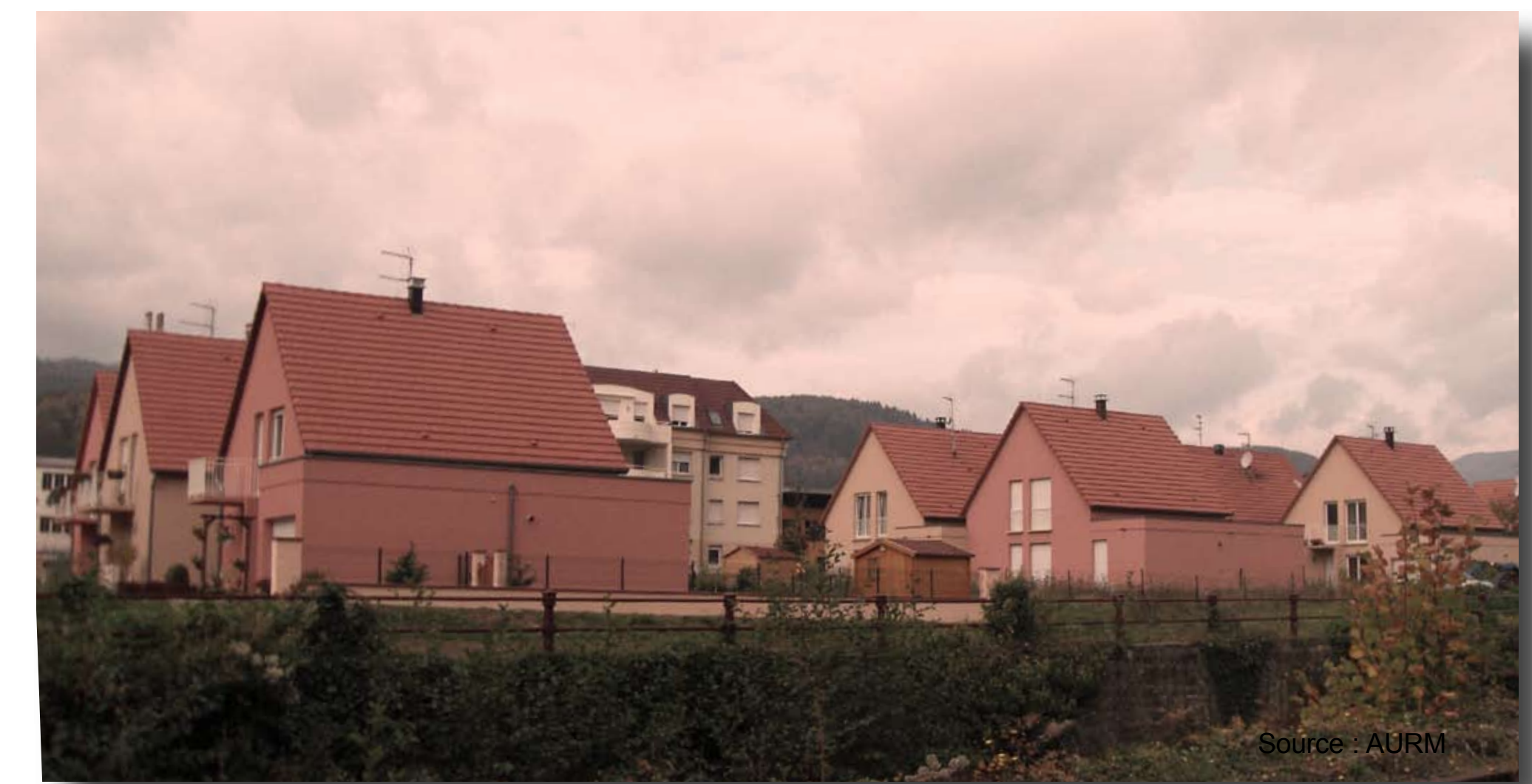
Le SCoT oriente l'urbanisme opérationnel et l'urbanisme réglementaire sur le territoire.

Le SCoT est un document partagé. Pendant toute la durée de l'élaboration du projet, les habitants, les associations locales et les personnes concernées sont associées.