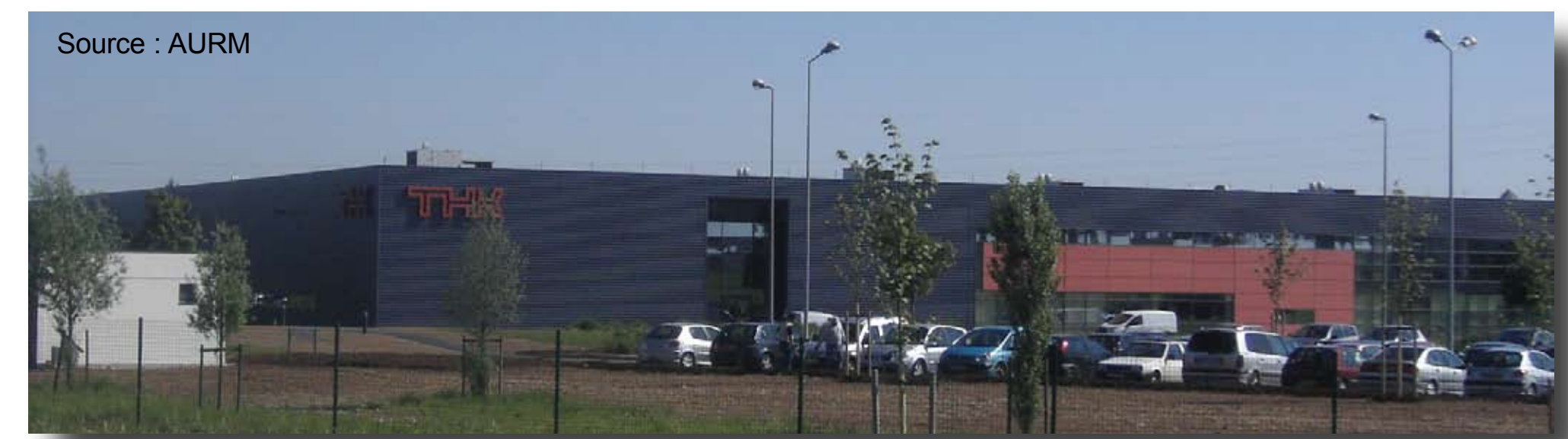
La ZAID d'Ensisheim de 114 hectares

Une attractivité fondée sur une grande accessibilité et du foncier facilement mobilisable.