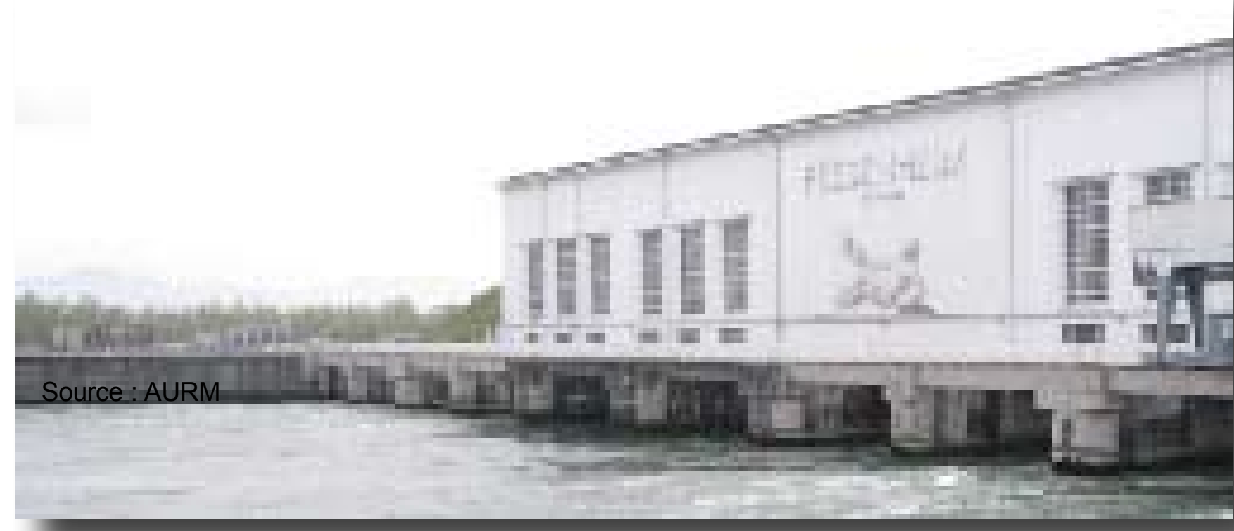
La centrale hydraulique de Fessenheim sur le canal du Rhin

Le secteur comprend la plaine d'Alsace et la Hardt. Situé entre Mulhouse et Colmar et desservi par l'autoroute A35, il est particulièrement attractif. Son économie est principalement fondée sur les zones d'activités d'Ensisheim, la centrale nucléaire de Fessenheim, la base militaire aérienne de Meyenheim en reconversion et une agriculture céréalière d'exportation. La Plaine compte 7 800 emplois privés.