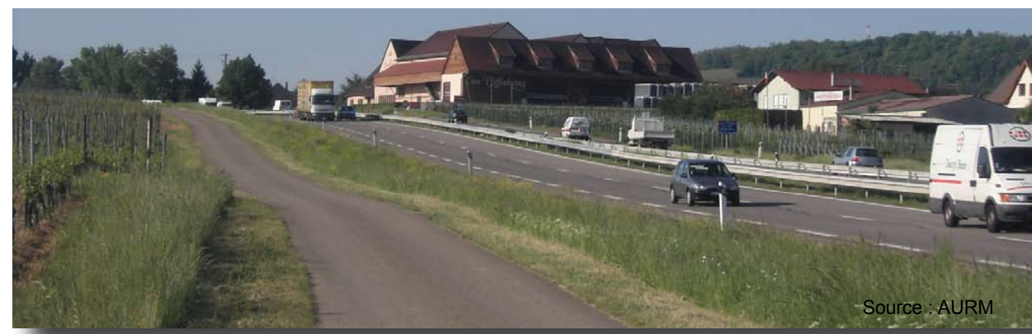
Des déplacements quotidiens principalement motorisés

Plus de la moitié des actifs résidant sur le territoire travaillent à l'intérieur du périmètre du SCoT. 23% se déplacent quotidiennement vers la région mulhousienne pour y travailler, et 11% vers le territoire du SCoT de Colmar.