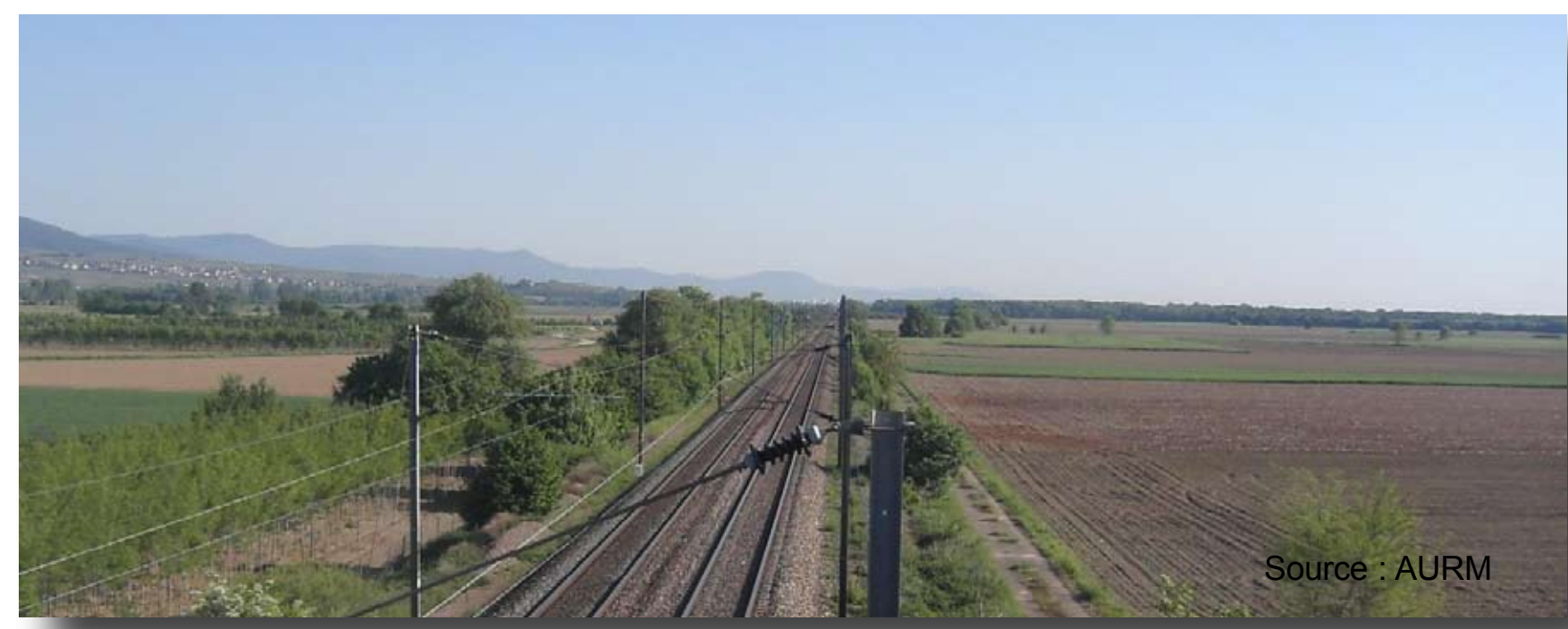
La ligne Strasbourg-Mulhouse-Bâle : une infrastructure ferroviaire d'intérêt régional

“Les pôles d'emplois générateurs du plus grands nombres des déplacements.”