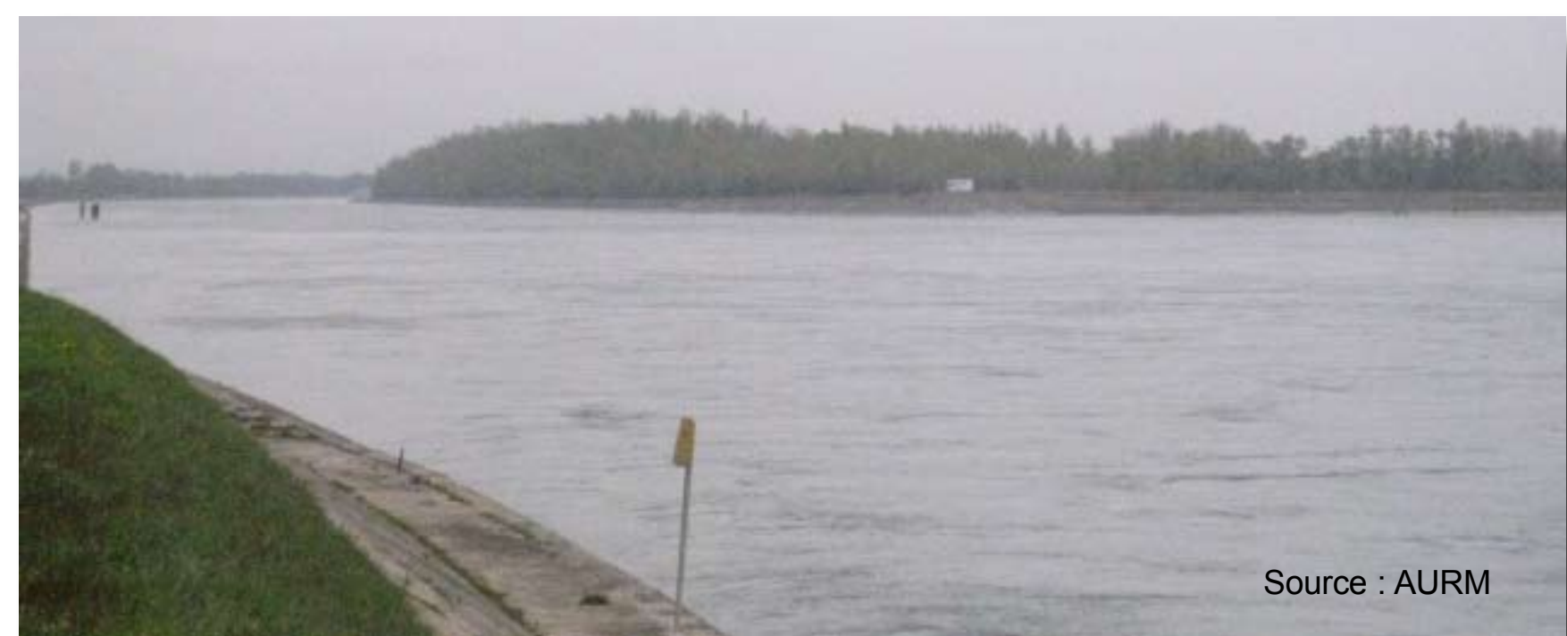
Le canal d'Alsace, un axe fluvial européen