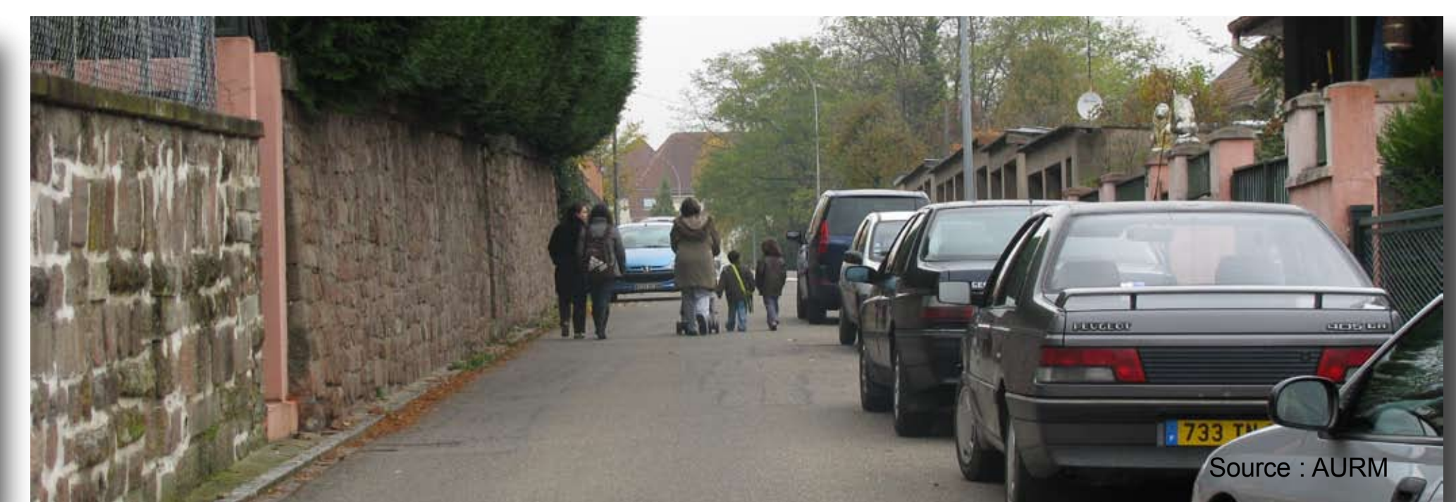
La place des piétons dans la rue réduite au profit des voitures