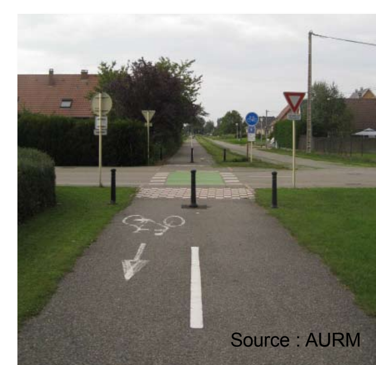
Des aménagements cyclables à poursuivre

“Les déplacements quotidiens modes doux : marche à pied et vélo sont peu développés.”